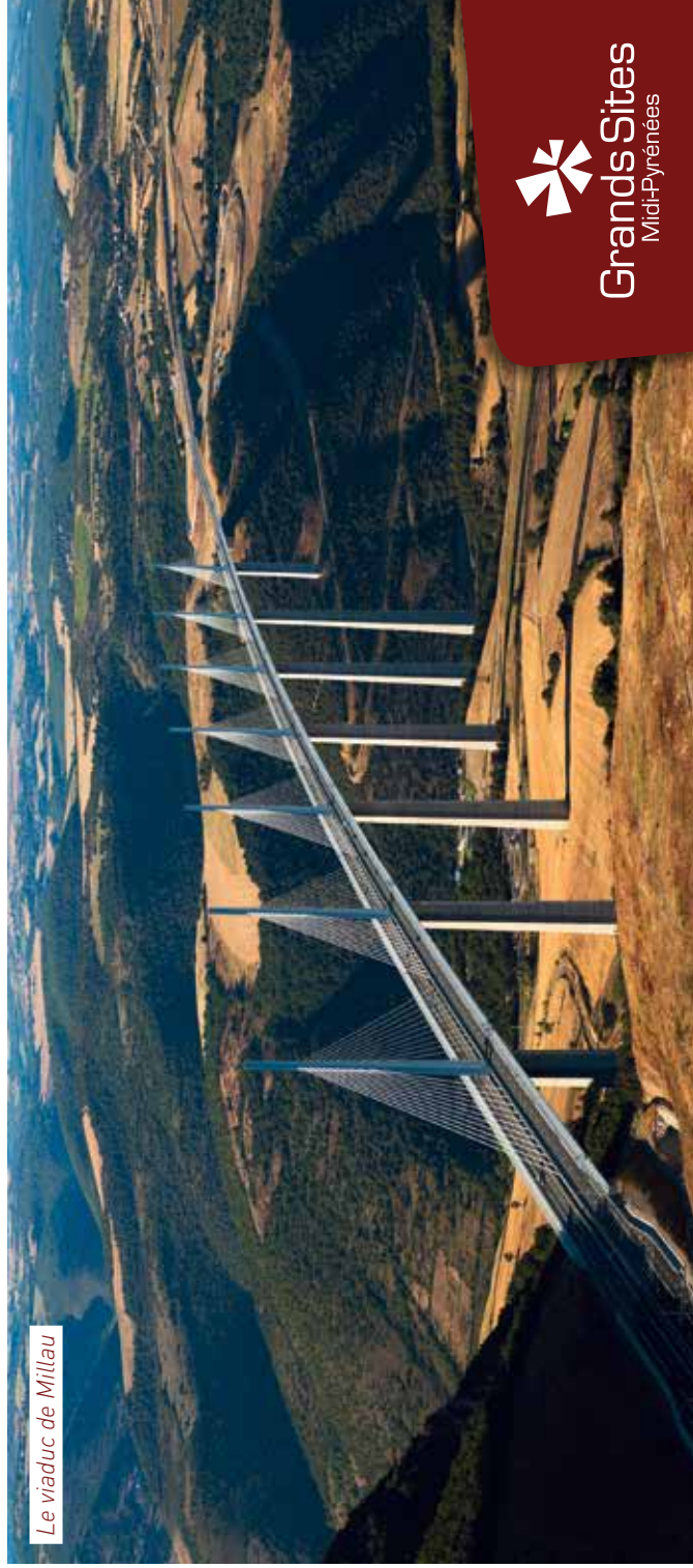
Le viaduc de Millau

Jours fériés 2016, se reporter aux horaires du dimanche (1er janvier, 28 mars, 1er mai, 5 mai, 16 mai, 14 juillet, 15 août, 1er novembre, 11 novembre et 25 décembre).